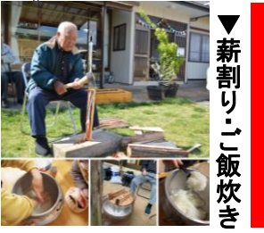
▼薪割り・ご飯炊き