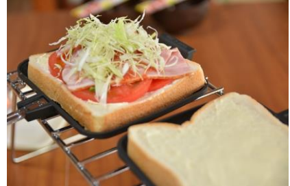
ホットサンド作り